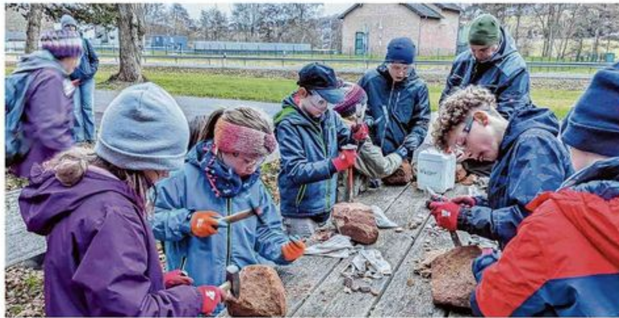
Ein Projekt, viele geheimnisvolle Aktivitäten: Unter anderem wurde getastet und gemeißelt in Kall.

pen – es ist völlig offen«, erklärt sie. Auch Senioren- und Rentnergruppen sind willkommen. Gesucht werden auch Tutoren, die Gruppen bei ihren Entdeckungstouren begleiten möchten. Interessierte können sich gerne per